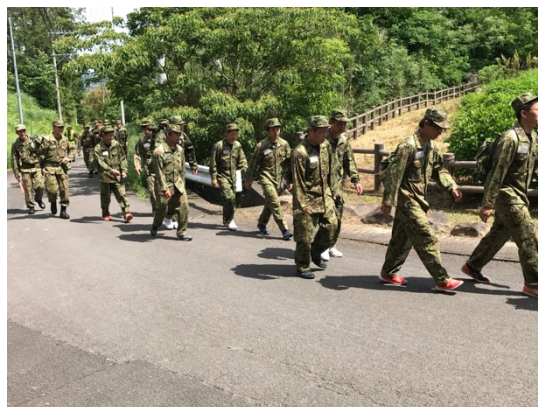
←川北電工さん体験入隊の様子